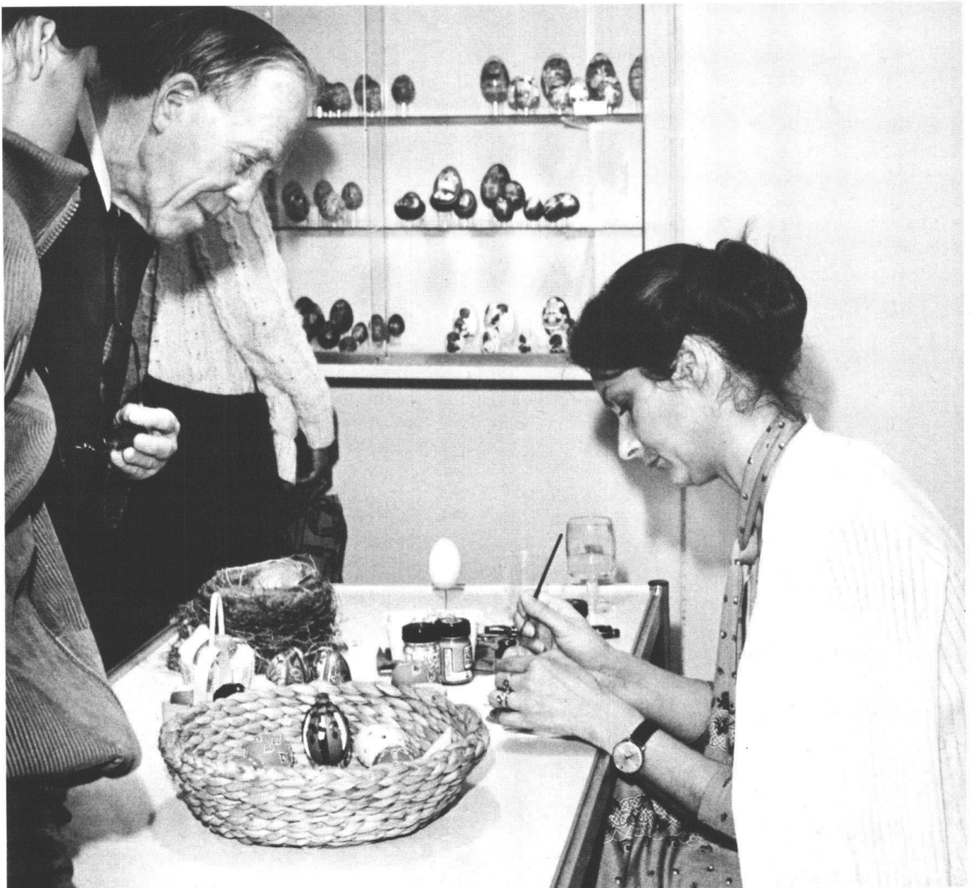
La traditionnelle exposition d'œufs de Pâques, au Centre suisse de l'artisanat, n'est pas seulement présentée sous vitrines, mais montre aussi une artiste au travail.

te », au Helmhaus de Zurich, montrera jusqu'au 1 er juin ce qu'est l'artisanat d'art. Et à partir du 20 juin, on pourra voir à Lausanne l'exposition « Art populaire suisse d'aujourd'hui ». Dès le 6 septembre, l'école de Richterswil présentera les travaux de soixante anciennes élèves des cours de tissage. Enfin, dès le 19 septembre, on verra au « Heimethuus » les travaux primés du concours « Nouveaux souvenirs de voyage suisses ». Christian Schmidt