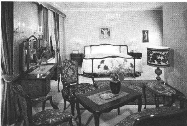
Hinter dem Riegel des Hotels «Krone» in Gottlieben TG verbirgt sich ein wahrer Schatz kunstvoller Innenausstattung. Oben ein Luxuszimmer im Louis-XV-Stil, unten eine Aussenansicht des unter grossen Opfern des Besitzers vollständig renovierten Gebäudes. (Archivbilder)