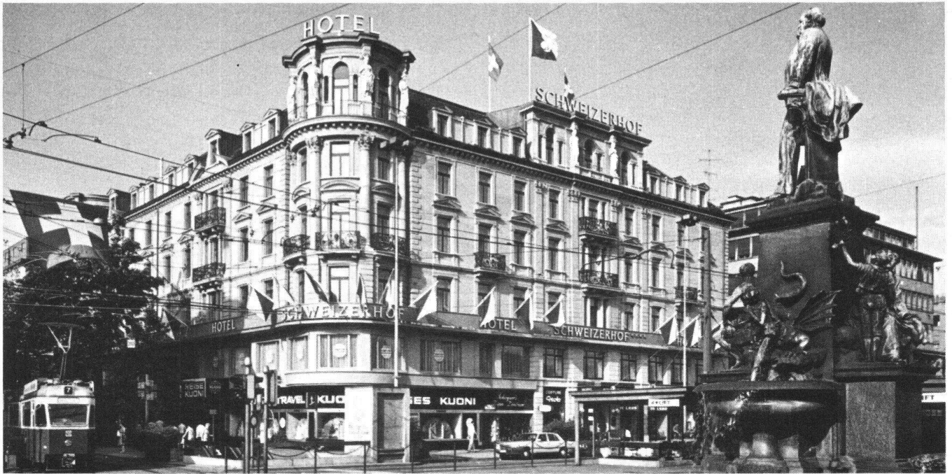
Le «Schweizerhof» de Zurich ne répond plus qu'en partie à sa destination première. Le rez-de-chaussée et le premier étage ont été aménagés en magasins et bureaux, ce qui a beaucoup altéré les anciennes façades, d'un très beau classicisme. (Photo d'archives)

Autre cas: celui d'un hôtel partiellement détruit par le feu et pour lequel le Service de protection, lors du projet de reconstruction, a imposé certaines normes (surtout en ce qui concerne la toiture). La durée de la reconstruction en a été rallongée, sans que le Service de protection – comme on l'a dit plus haut – eût la possibilité de contribuer à cette perte supplémentaire. La compagnie d'assurance, de son côté, a fait valoir qu'en vertu des conditions générales d'assurance, elle n'avait pas à intervenir pour le dommage résultant du retard. Une part assez considérable des dégâts est donc restée non couverte, bien que la reconstruction, du fait d'une sous-assurance partielle, ait de toute façon mis l'hôtelier dans une situation difficile. Il est hors de doute que les contraintes de la protection des édifices impose parfois une lourde charge à l'hôtelier. Coincé entre les lois économiques et les exigences esthétiques, il opte pour une solution qui est souvent favorable au site.