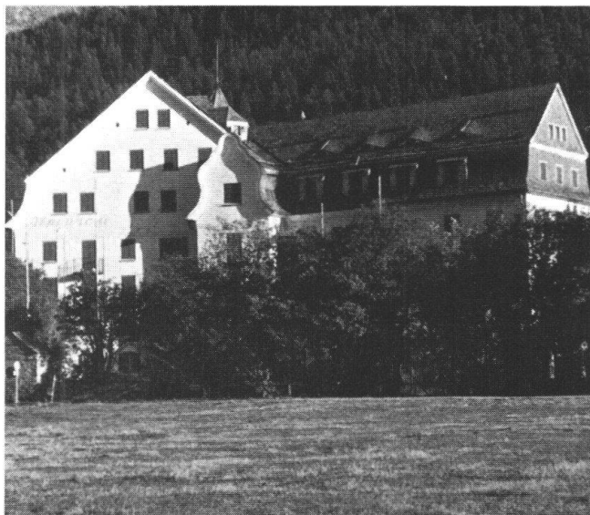
L'«Alpenrose», à Sils, est un des hôtels engadinois les plus riches de tradition. Fermé depuis plusieurs années, il sombre visiblement dans la décrépitude, et il ne restera finalement plus qu'à le démolir. On peut se demander ce qui va surgir à sa place...

Par leur interdiction de ventes d'immeubles à des étrangers, les Communes de Sils , Silvaplana , St-Moritz , Pontresina , Celerina , Samedan (là une initiative est en cours, dont le succès n'est pas douteux), Bever et La Punt-Chamues-ch ont cherché à enrayer la spéculation. Il est certain qu'un certain apaisement a été obtenu. Quelques autres Communes ont pris des mesures restrictives et sont sur le point de perfectionner leurs règlements de construction. La demande va certes reculer, si les achats spéculatifs par des étrangers sont empêchés. Mais il y aura plus. C'est ainsi qu'à une assemblée du Groupe de planification régionale de Haute-Engadine , un citoyen a demandé une modification du droit sur les sociétés par actions, vu que le droit actuel offre des possibilités de tourner la loi. Dans les assemblées annuelles des sociétés de commerçants et d'artisans, on a demandé aussi une modification du droit fiscal, vu que les forts impôts sur la fortune, et les évaluations toujours plus massives de la valeur des immeubles (tout bien-fonds augmente continuellement de valeur sur le papier, ce qui est aussi une conséquence des prix du sol que fait grimper la spéculation), ont dans de nombreux cas