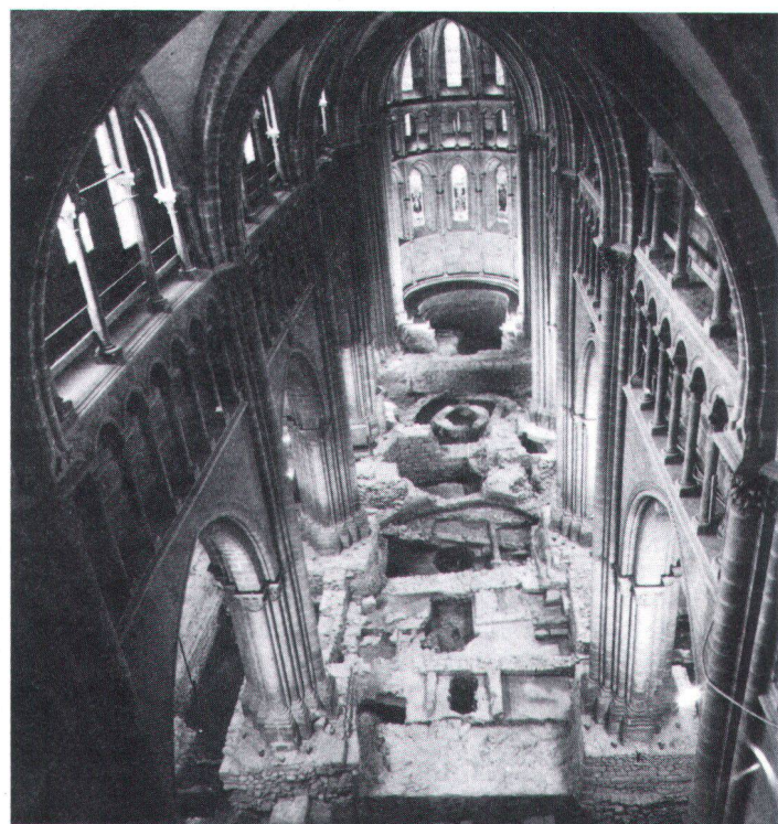
Coup d'œil sur les fouilles archéologiques de la cathédrale de Genève.

Diverses installations ont été introduites du point de vue de la sonorisation, de même que tout le cablage nécessaire pour des émissions radio-télévisées. Dans le chœur, des estrades mobiles encastrées, revêtues de dalles en grès, ont été posées. Elles seront utilisées par des chœurs lors de certains concerts. Enfin, des essais acoustiques ont été entrepris, de façon à procéder à des améliorations. On a, par exemple, posé des abat-son à la hauteur de la galerie du triforium. Les restaurateurs ont cherché également à mieux adapter l'éclairage à la qualité architecturale de l'édifice, de façon à faire ressortir le matériau d'origine, la molasse du lac. On a dissimulé dans les galeries des projecteurs, utiles pour les concerts ou les manifestations.