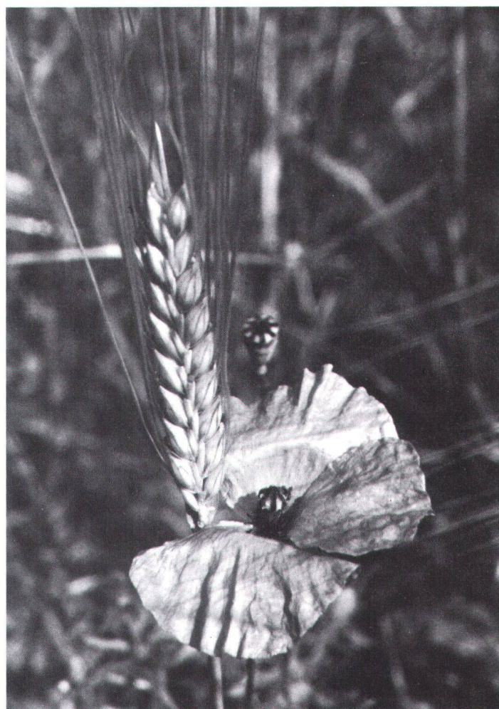
Der diesjährige Talerverkauf «Aktion Kornblume» will dem weiteren Rückgang der als Unkräuter betitelten Blumen – wie Kornblume, Feuermohn, Kornrade, Venusspiegel, Adonis und Feldrittersporn – entgegenreten.

De nombreuses plantes qui, il y a quelques décennies encore, égayaient les champs de céréales, les prairies, les vignes, les bords de chemins et les déblais, sont aujourd'hui menacées d'extinction.