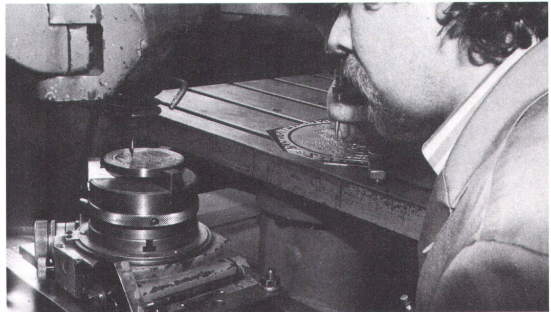
Gravierung des Prägestempels: ob 1982 noch mehr Taler geprägt werden als im vergangenen Jahr?

Gravure de la matrice. Et si l'on vendait encore plus d'écus que l'an dernier?