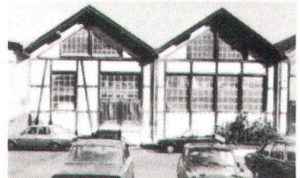
La fabrique Rondez, près Delémont, figure à l'inventaire suisse d'architecture moderne.

Im Inventar der neueren Schweizer Architektur enthalten: die Rondez-Werke bei Delsberg.