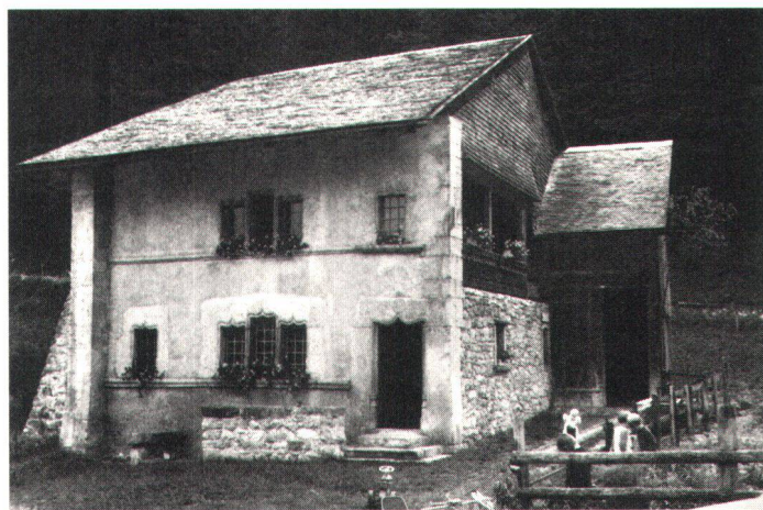
La Maison du Banneret, à Grandvillard FR (1666), a été achetée par le Musée gruérien, restaurée, puis revendue à un particulier après sa mise sous protection légale. Das Haus Banneret in Grandvillard FR (1666) ist vom Greyerzer Museum gekauft, restauriert und dann mit Schutzauflagen an einen Privaten verkauft worden.