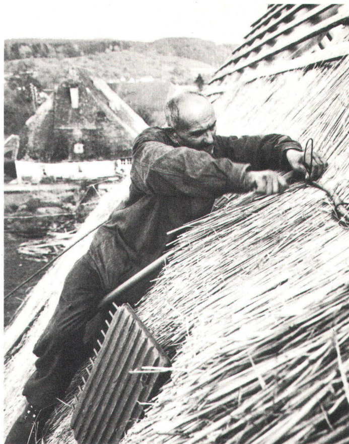
Nach dem Brand musste das Strohdach wieder fachgerecht repariert werden.

Nach gut zwei bis drei Jahrzehnten der Übernahme und Entwicklung vom Strohhäuser bis zum Museum musste man sich doch die Frage stellen, ob es auf die Dauer Aufgabe des