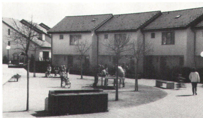
Verkehrsfreier «Dorfplatz» in der Überbauung «Lindenwiese».

Die Siedlungsform wird dabei wieder einen mehr städtischen Charakter erhalten und sich eindeutig von der Landschaft