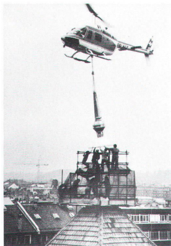
Montage d'une pointe faîtière de cuivre sur la maison Saussure, à Genève: par le ciel, c'est plus facile...

Depuis quelques années, on utilise également, pour la ferblanterie des bâtiments à valeur historique, très fréquemment du cuivre étamé; les pièces ainsi réalisées conservent une couleur grise. L'étain, en pâte, est généralement appliqué sur la pièce une fois terminée, ce qui donne une homogénéité. Le cuivre naturel, pour sa part, s'oxyde plus ou