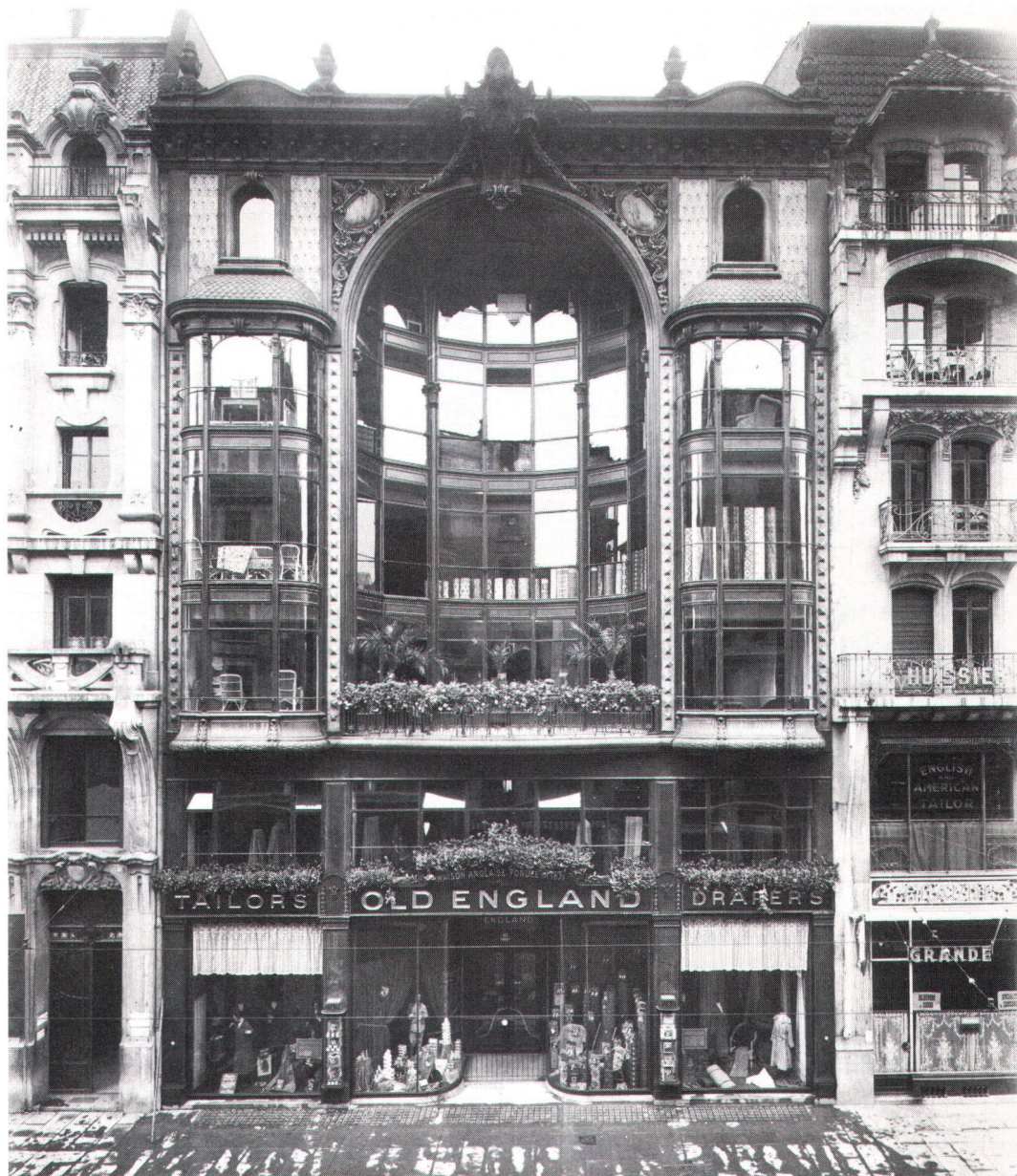
La façade originelle de l'UNIP, à Genève, à la riche ornementation de zinc

Au XV e siècle, par exemple, on travaillait déjà la tôle dans