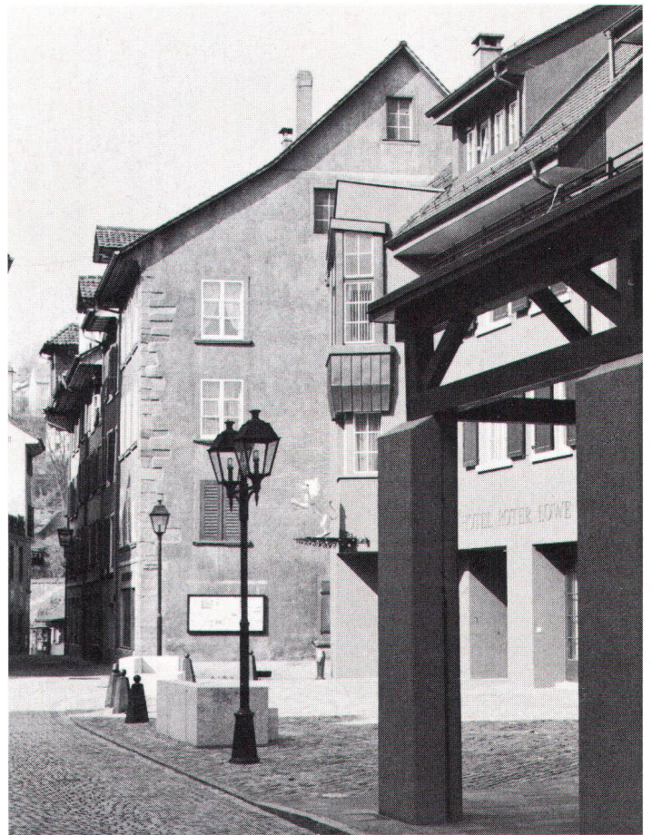
Tragbarer Versuch, neue Architektur mit der bestehenden zu verbinden

– der Wohnlichkeit der Altstadtwohnungen ( Besonnung,