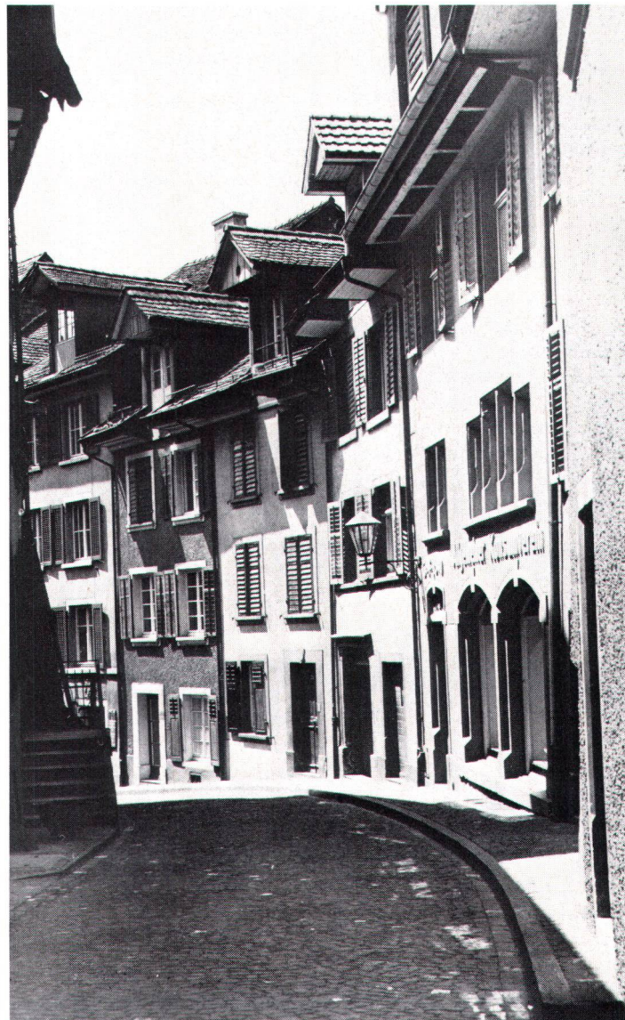
Altstadtromantik ohne perfektionistische Allüren in Laufenburg

Mit einer Wiederholung des 1959 uraufgeführten Tonlichtspieles «Son et lumière» hat Laufenburg AG am 16. Juni die Übernahme des Wakker-Preises 1985 des Schweizer Heimatschutzes (SHS) gefeiert. Welche planerischen Massnahmen nötig waren, um das mittelalterliche Städtchen aber soweit zu bringen, zeigt der folgende Beitrag.