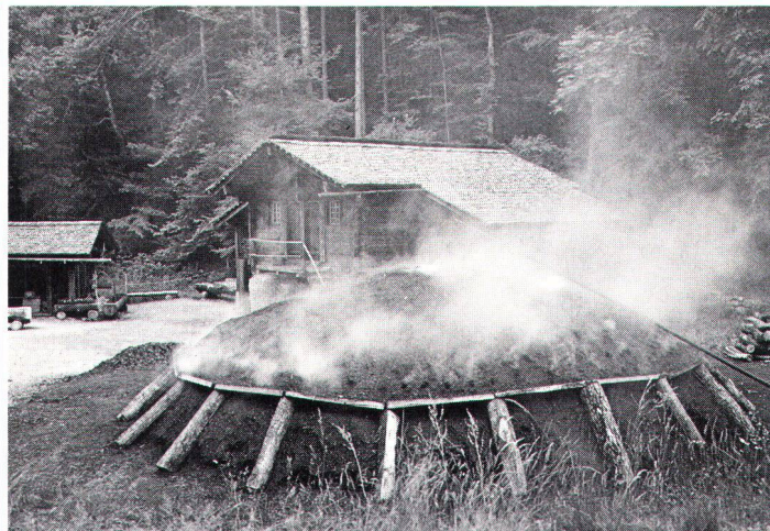
Ländliches Gewerbe im Freilichtmuseum: Oben Köhlerei, unten links Vorführung am Spinnrad, unten rechts in der ehemaligen Schmiede von Bümpliz BE

Depuis le milieu des années septante, le Musée a aussi l'appui de la Commission fédérale des monuments historiques, qui a notamment contribué à éliminer tout antagonisme avec les services officiels de protection. Depuis 1983, aucun transfert d'édifice au Ballenberg ne se fait sans accord avec ces services, et presque toutes les acquisitions de ces dernières années ont été réalisées sur l'initiative de Cantons