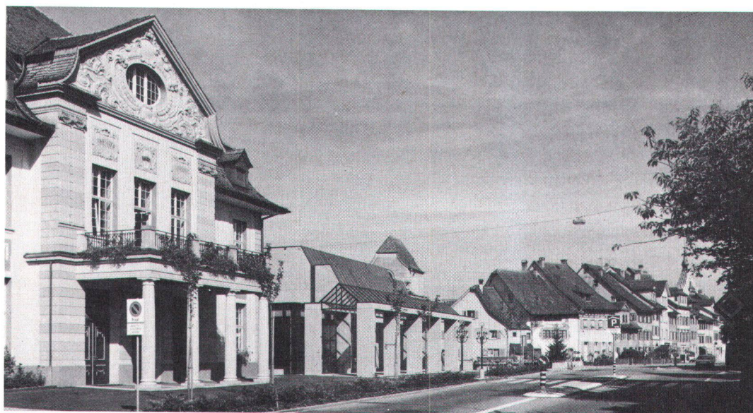
Der zwischen Altstadt und dem 1909 errichteten Casino gut eingeordnete Theaterneubau in Zug

A Zug, le nouveau théâtre s'insère bien entre la vieille ville et le casino bâti en 1909.