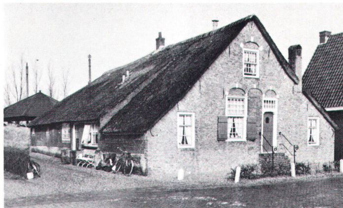
Volkskundlich wichtige Bauernhäuser, die älter als 50 Jahre sind, fallen unter das Denkmalschutzgesetz (Archivbild)

Les maisons rurales intéressantes qui ont plus de 50 ans sont soumises à la protection légale.