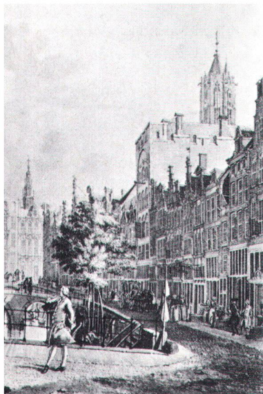
Le comblement des canaux (ici celui de l'Oude à Utrecht, d'après Jan de Beyer, 1753) a été aux Pays-Bas un puissant déclencheur du mouvement de protection des sites.

Dem Minister steht ein unabhängiges Beratungsgremium zur Seite: der Denkmalrat (Monumentenraad). Er hat fünf Abteilungen: die Staatliche Kommission für Denkmalpflege (Rijkscommissie voor de Monumentenzorg), das Staatliche Amt für Archäologie (Rijkscommissie voor het Oudheidkundig Bodemonderzoek), die Staatliche Kommission für Kunsttopographie (Rijkscommissie voor de Monumentenbeschrijving), die Staatliche Kommission zum Schutze von Denkmälern gegen Katastrophen und Kriegseinwirkungen (Rijkscommissie voor de Bescherming van Monumenten tegen Rampen en Oorlogsgevaaren) und die Staatliche Kommission für Museen (Rijkscommissie voor de Musea). Ein grosser Teil der denkmalpflegerischen Aufgaben ist dem Staatlichen Amt für Denkmalpflege übertragen (Adresse: