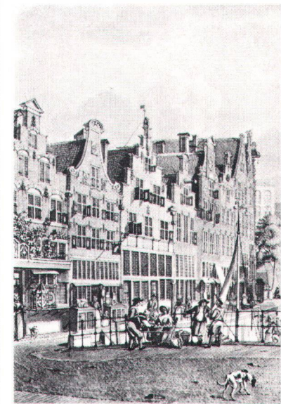
Die Zuschüttung der Grachten (im Bild die Oudegracht in Utrecht nach Jan de Beyer, 1753) war in den Niederlanden ein wichtiger Auslöser der Heimatschutzbewegung

denkmälern möglichst zu verhüten, fördert ihre Wiederherstellung und ist bestrebt, die alten Stadt- und Dorfkern zu erhalten. Weitere Aufgaben der Zentralbehörde sind: Unterstützung der Vereinigungen, die sich mit der Pflege