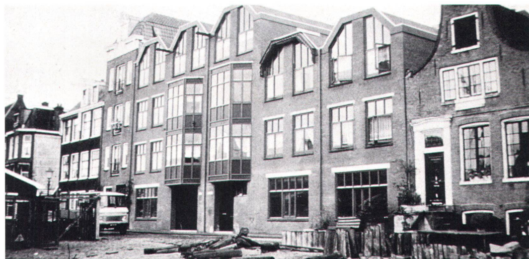
Neues Bauen in alter Umgebung, ein Thema, das die Bauberater des «Bond Heemschut» intensiv beschäftigt

Die Stiftung Denkmalschutz Niederlande (Monumentenwacht Nederland) : Diese Stiftung setzt sich zum Ziel, historisch bedeutsame Bauten in den Niederlanden vor dem Verfall zu bewahren. Zu diesem Zweck lässt sie die bei ihr