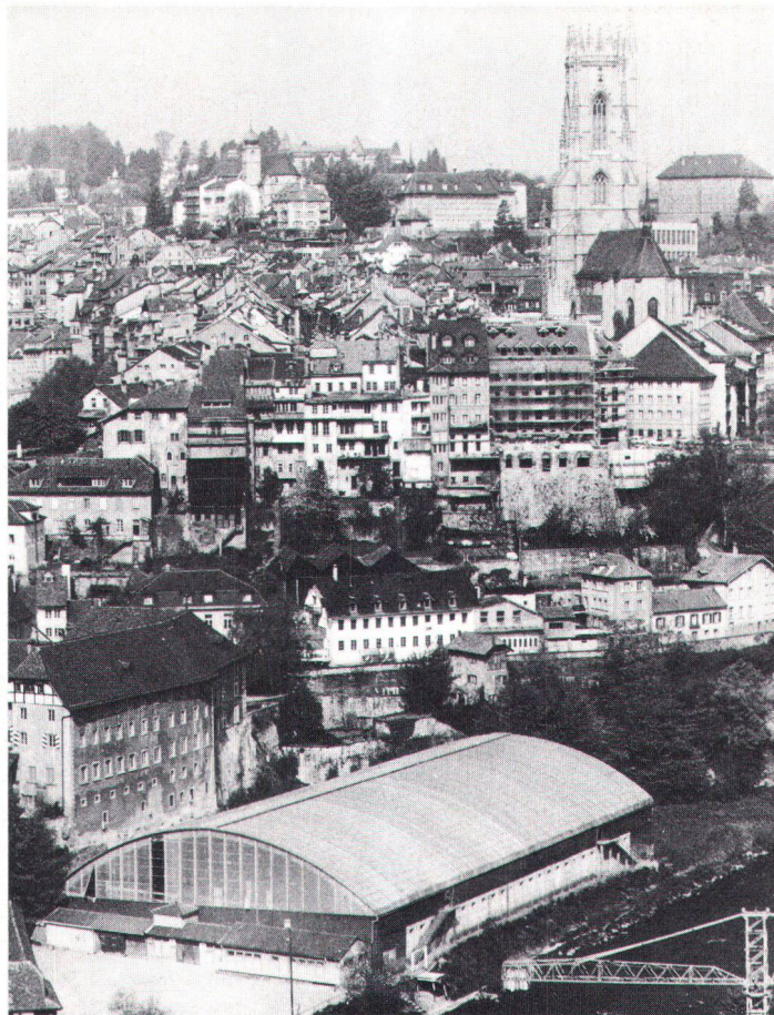
Aus ortsbildschützerischen Gründen glücklicherweise verschwunden: die Freiburger Eishalle

Hier ist daran zu erinnern, dass die räumlichen Folgen von Hallensportanlagen praktisch endgültig und kaum mehr zu beheben sind. Die häufig überproportionierten Bauten beanspruchen den gerade für die Berglandwirtschaft so wichtigen Boden in der Talsohle, wirken preistreibend und fördern damit indirekt auch die Konzentration des Grundeigentums. Und im Mittelland werden solche Anlagen nicht selten in grünen Randzonen erstellt, um dadurch den an sich begreiflichen Forderungen der Sporttreibenden nach Ruhe, sauberer Luft und möglichst viel Natur entgegenzukommen. Bedauerlich daran ist vor allem, dass sich diese Anlagen fast ausnahmslos schlecht in die Landschaft fügen und die Massstäblichkeit der historisch gewachsenen Strukturen sprengen. Zudem handelt es sich hier meistens um reine Zweckbauten aus Fertigele-