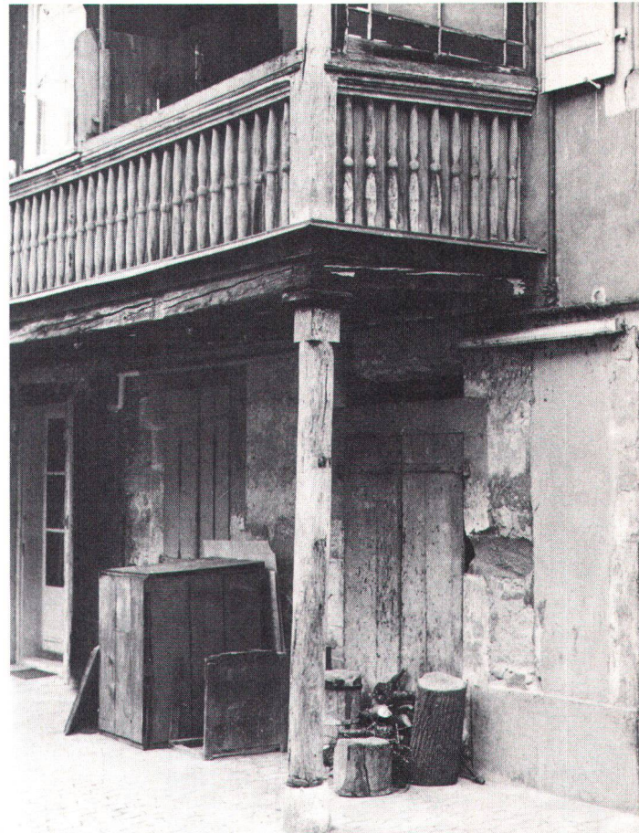
Les éléments de bois peuvent avoir divers buts – fonctionnels ou décoratifs

On observe actuellement l'apparition sur le marché de la construction de produits divers, qui, à un titre ou un autre ont fonction de succédané par rapport au bois: fenêtres en matières synthétiques, volets en aluminium, pièces diverses en métal éloxé etc. Tous ces produits ont l'avantage de nécessiter un entretien minimum. Par contre, leurs fabricants restent particulièrement discrets sur l'aspect qu'ils prennent après quelques années d'un inévitable vieillissement. Les principes adoptés en matière de conservation de notre