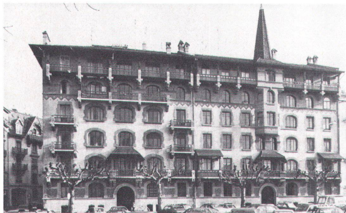
En haut: maison édifiée en 1907 par Léon Bovy, 10–12, avenue de la Gare des Eaux-Vives; en bas, édifice construit en 1895 par Frédéric de Morsier, 75–77, boulevard St-Georges

Fruit d'un fervent travail d'équipe, ce guide, limité à la ville, est le premier qui soit consacré à l'architecture genevoise du XIX e siècle. Il est divisé en douze promenades de quartiers, précédées d'un tour de la Genève romantique. Il s'adresse à tous ceux qui aiment Genève, et particulièrement aux Genevois. En leur révélant la qualité du paysage de pierre dans lequel ils vivent, il a l'ambition de leur donner de nouvelles raisons d'apprécier leur ville et d'accroître en eux le désir de la préserver intacte pour les générations futures. Jean-Daniel Candaux