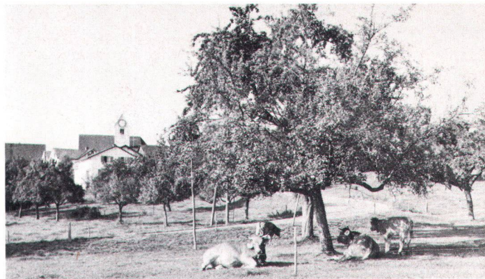
In den letzten Jahren sind viele Landwirte dazu übergegangen, wieder hochstämmige Obstbäume anzupflanzen. Ces dernières années, de nombreux agriculteurs se sont remis à planter de vrais arbres fruitiers, hauts sur pied.

Konkret bedeutet das, dass von einer längerfristig ausgelegten Agrarpolitik in erster Linie bessere Voraussetzungen für eine markt- und umweltgerechte Landwirtschaft verlangt werden. Dies erfordert auch die Bereitschaft, mit Kritikern der heutigen Agrarpolitik zu verhandeln. Diese grundsätzlichen Forderungen werden mit der recht hohen Bereitschaft bekräftigt, auch persönlich möglichst umweltschonende Produktionsverfahren anzuwenden. Immer-