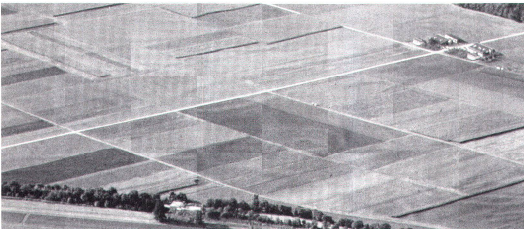
Meliorationen werden von den Bauern positiv bewertet, sie sehen aber zusehends auch deren Nachteile.

Les améliorations foncières sont jugées positives par les paysans, qui cependant en voient toujours davantage les inconvénients.