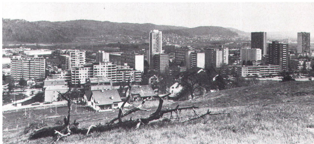
Lineares Wachstum der Baumasse führt zu exponentiellem Anwachsen der Verheerung.

Eine andere These lautet: «Seine Tätigkeit richtet er sowohl auf die Erhaltung bestehender Lebensräume als auch auf die Gestaltung neuer aus.» Die Entstehung der vorhandenen Lebensräume habe ich begriffen. Wo aber finden sich in der Schweiz die zu gestalten den neuen? Wo im Hauptfeld der praktischen Arbeit der Kulturlandschaft hat es noch Platz für neue Lebensräume? Wo in der Agglomeration, die «Schweiz» heisst, kann der Heimatschutz noch gestalten? Im weitem heisst es in den Genfer Thesen: «Er verfolgt