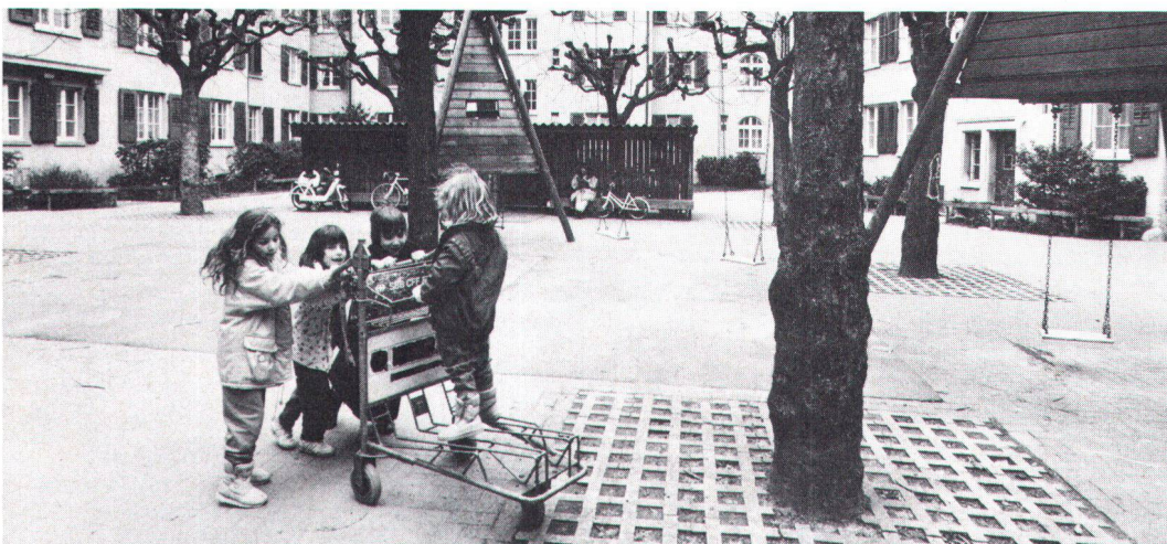
... er muss heute auch dazu beitragen, die verödete Agglomeration in einen lebenswerten Ort umzugestalten.

Damit komme ich endlich zur Sache: Heimatschutz wozu? Wir brauchen Heimatschutz, weil wir in einem radikalen Zeitalter leben. Denn wir können heute nicht einfach etwas mehr von dem erleben, was früher auch schon war, sondern völlig Neues. Quantität hat längst in negative Qualität umgeschlagen. Das Jumbo-Chalet ist eine hybride Züchtung mit Sentimentalität als Mutter und Geldgier als Vater. Es ist gross und hässlich. Stelle ich 100 Chalets auf eine Alp, so habe ich nicht einfach hundert Chalets, sondern alles ist hundertmal hässlicher. Lineares Wachstum der Baumasse führt zu exponentiellem Anwachsen der Verheerung . Spätestens seit der Einführung der Fruchtfolgeflächen ist auch klar, dass die Schweiz voll und die Zeit der Expansion zu Ende ist. Wir haben keine Auswegmöglichkeiten mehr. Und von der Umwelt zu reden, erspare ich dem Leser. Denn er weiss, wir haben nur noch eine Frist. Zusammengefasst: Wer will, dass alles so weitergeht, hilft mit, dass alles so weitergeht. Darum ist Heimatschutz ein Teil des Gesamtprogrammes « Erhaltung der Art » geworden. Wir brau-