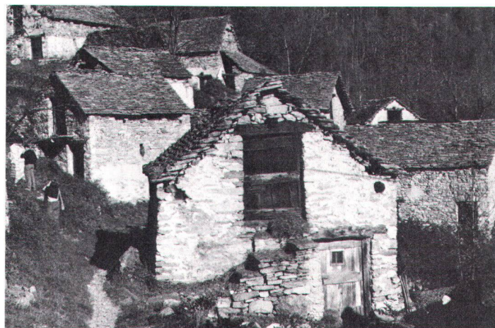
Etables abandonnées, au Tessin. Verlassene Ställe im Tessin

C'est avec des moyens très simples et sans machines, à part le palan, un trépied ou autre instrument primitif pour soulever que ces bâtisses ont été édifiées, les procédés se transmettant de génération en génération et s'affinant continuellement. Et toujours on cherchait l'équilibre entre la dépense d'énergie des hommes et de ses animaux de trait, et l'utilité qu'apportait la construction. Force d'invention, trouvailles, observation de la nature, tradition, y avaient leur part. C'est ainsi que ces bâtiments utilitaires résultaient en fin de compte d'un dialogue entre l'homme et la nature. Et c'est bien ce dialogue auquel nous prêtons l'oreille dans la gran-