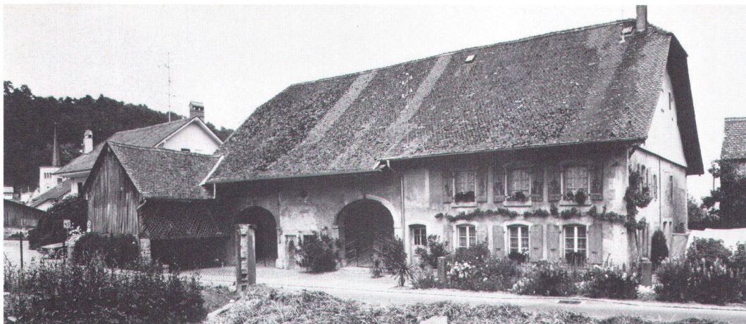
En pays de Vaud – ici près de Payerne – l’habitation et les dépendances sont sous le même toit. Im Waadtland – unser Bild entstand bei Payerne – liegen Ökonomie- und Wohntrakt unter einem Dach

fenêtres, portes et balcons, leurs cheminées, escaliers, charmilles, ont un aspect d’une riche variété, que complètent les façades extrêmement sobres des granges: mur recouvert de planches au-dessus d’un socle de maçonnerie, et porte; paisible uniformité; peuvent s’y ajouter une fenêtre d’étable et une autre porte, mais ce sont aussi des éléments très simples et très semblables. La grange-étable dégage ainsi, à l’extérieur également, une impression de grande simplicité, que seule trouble, on ne le sait que trop, les affiches publicitaires placardées sur leurs murs.