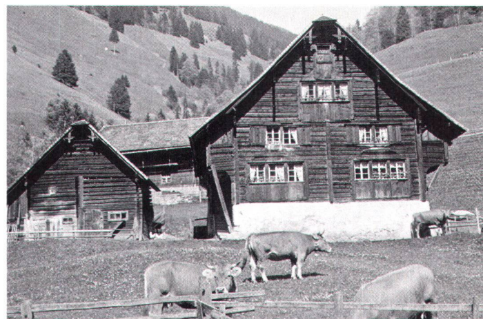
Habitation et grange-étable séparée forment ici, en Suisse centrale, une unité architecturale.

A leur tour, les greniers valaisans diffèrent les uns des autres, selon leur époque, leur position dans le groupe ou par rapport au chemin, ou encore selon leur orientation, etc. Souvent, les dépendances portent aussi des inscriptions gravées dans le bois (nom du propriétaire ou du charpentier), et souvent elles sont peintes; en terre fribourgeoise , des montées à l'alpage ( pozas ) s'abritent sous le large auvent de la grange. Nous connaissons des sculptures sur bois, ornant