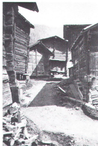
Charme de la simplicité au Biel près Geschinen VS. Zauber des Einfachen im «Biel» zu Geschinen VS

veau de vie s’est élevé, le rythme de la vie quotidienne s’est puissamment accéléré, les in-