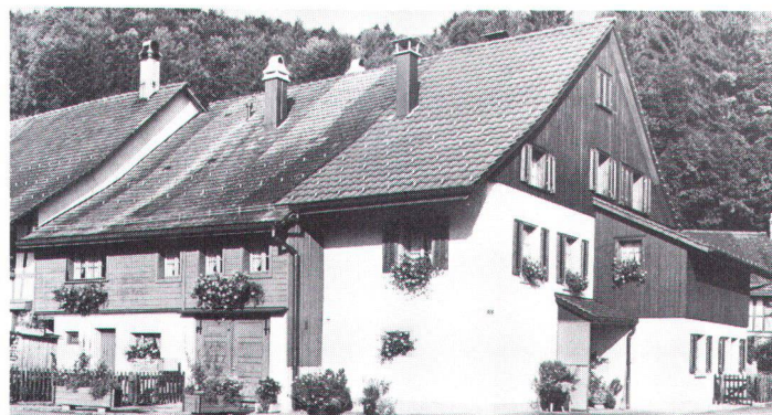
Totale Umnutzungen verändern die Dorfstrukturen und bestimmen die Bodenpreise von morgen Les changements complets d'affectation transforment la structure villageoise et déterminent les prix du sol pour demain.

2. Es darf deshalb nicht sein, dass Bodenpreise oder höhere Bruttorenditen für eine bestimmte Umnutzung die Standortstrukturen der Dörfer vollständig zu bestimmen beginnen. Eine konsequente Ausrichtung der Nutzungen im Dorf nach Massgabe dieses Kapitaldruckes zerstört gerade das Provisorische, Extensive, Freiraumhafte und Improvisierte vieler dörflicher Nutzungen des Bodens und der Bauten. Bestehende Landwirtschaftsbetriebe im Baugebiet wollen einer Landwirtschaftszone (Bauernhofzone) zugeteilt werden. Auch leerstehende, erhaltenswerte Ökonomiebauten sollten in einer Bauernhofzone umgezont werden. 3. Wir empfehlen deshalb, in den Ortsplanungen in dieser Richtung der Vernetzung der bäuerlichen Betriebsstandorte mit dem Ortsbild einerseits und einer stabilen Landschaft