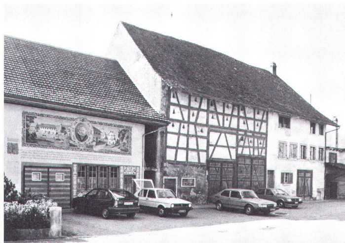
Embrach ZH: Erosion bäuerlicher Strukturen A Embrach ZH: érosion d'une structure architecturale paysanne.

1. Wir müssen die Erhaltung der landwirtschaftlichen Bauten als Teil eines grossen ländlichen Reformwerkes sehen, das einerseits die bauliche Erneuerung der Landwirtschaftsbetriebe in angestammten Strukturen fördert und andererseits auch im Bereich des Kulturlandes einen «Rückbau» einleitet zur Erhaltung