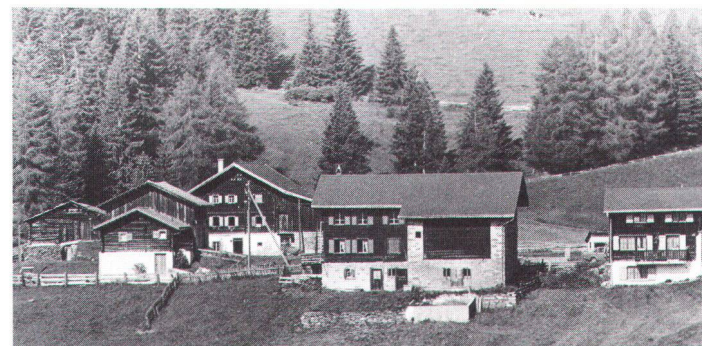
Sporz bei Lenzerheide GR: Einst Scheunen und Ställe, heute Restaurant mit separaten Zimmertrakten A Sporz près Lenzerheide: naguère étables et granges, aujourd'hui restaurant avec bâtiment d'habitation séparé.

Bisher hat bezüglich der Erhaltung landwirtschaftlicher Ökonomiebauten der denkmalpflegerische Einzelschutz im Vordergrund gestanden. Viele Ortsplanungen sagen über die landwirtschaftlichen Bauten nichts aus. Allenfalls äussern sie sich zur Erhaltung einzelner landwirtschaftlicher Bauten, auch innerhalb des Ensembleschutzes. Die in der Bauzone mögliche Nutzung bleibt auch bei solchen gestalterischen Festsetzungen wei-