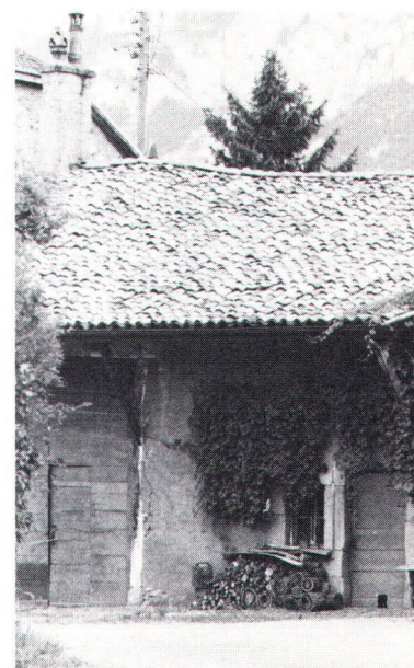
Partie d'une ferme genevoise à toiture ancienne de tuiles rondes. Teil eines Genfer Bauernhauses mit altem Rundziegeldach.