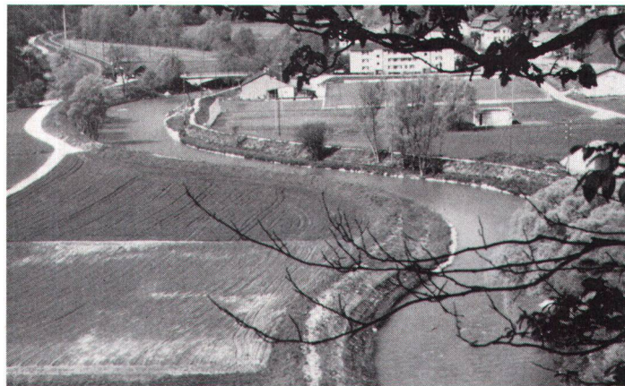
Ein gewundener Lauf entspricht dem Wasser mehr als eine Begradigung: hier die Birs-Korrektion in Liesberg.

gehölze und vor allem die letzten Wässermatten unter Naturschutz stellen. Wenn es die Platzverhältnisse und die Grundstücksbesitzer erlauben, sollten Flutmulden und Feuchtgebiete neu angelegt werden. Viele solcher Ersatzmassnahmen scheitern derzeit durch die agrarpolitischen Rahmenbedingungen am Druck auf den Boden. Dort, wo an der Thur der Kanton Zürich Landbesitzer der anstossenden Parzellen ist, ist es leichter, den Fluss ausufern zu lassen, als im Kanton Thurgau, wo bis ans Mittelwasserbett Ackerbau betrieben wird. Sehr schnell haben Wasserbauingenieure die Ideen des naturnahen Wasserbaus bei der Regulierung und dem Ausbau der Fliessgewässer aufgenommen. Allzu hoch geratene Absturzbauwerke wer-