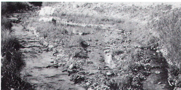
Niedrigwasserrinne am Prallufer und Flutmulde am Gleitufer bereichern das Bachbett des Eibaches. Le lit de l'Eibach amélioré: le courant varie selon la nature des rives.