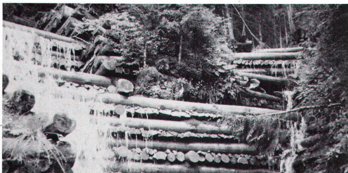
Noch heute funktionierende Holzschwellen in der Lenk. Palières de bois fonctionnant aujourd'hui encore dans la Lenk.