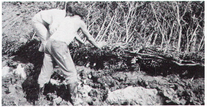
Quand l'ingénieur stabilise les rives avec des matériaux naturels (fascines de saule). Ingenieurbiologische Stabilisierung mit Uferfascine aus Weiden.