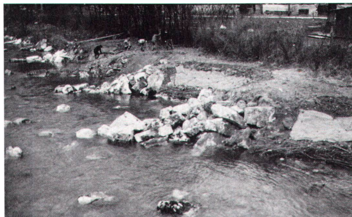
Die vorhandenen Steine wurden umgelagert zu fischfreundlichen und ingenieurbiologisch befestigten Buchten. Les pierres naguère alignées le long de la rive forment maintenant des anses favorables aux poissons et consolidées de façon naturelle.