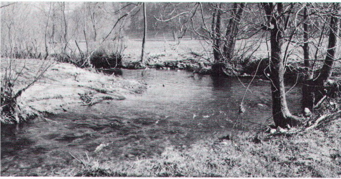
Pflegearbeit an der Önz: naturnahe Asymmetrie. Travail d'entretien pour l'Oenz: asymétrie proche de la nature.