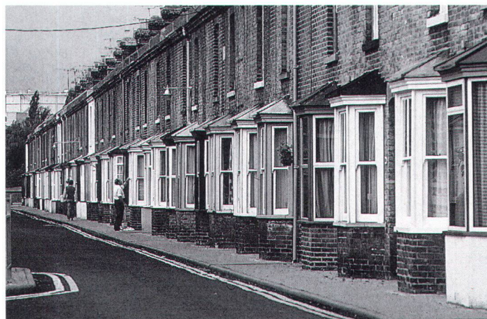
Die Erhaltung dieser Siedlung in Canterbury ist nicht denkbar ohne Bewahrung der inneren Bausubstanz und Besitzstruktur

dem öffentlichen, lauten Ruf nach Verdichtung und dem öffentlichen Auftrag der Denkmalpflege keine Konflikte gibt, oder ist der Ruf nach Verdichtung so übermächtig – politisch und sachlich –, dass Denkmalpflege gar nicht erst ihre Stimme erhebt?