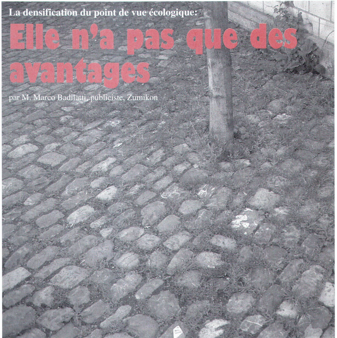
Pavage favorable, avec sa végétation, à l'infiltration des eaux. Sickerfreundliche Pflasterung mit Gras- und Baumwuchs.

par M. Marco Badilatti, publiciste, Zumikon