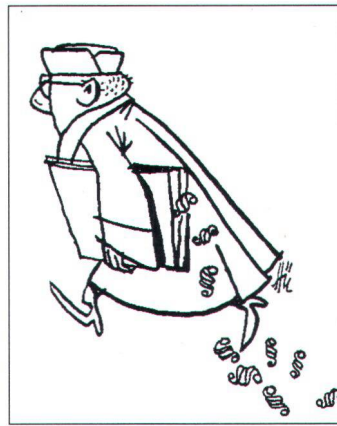
Illustration von Ernst Hürlimann aus «Juristen lachen»

Natur- und Heimatschutzes trotz gelegentlichen Unkenrufen von vereinzelt ewiggestrigen «Volks»- und anderen Interessenvertretern nicht mehr wegzudenken ist.