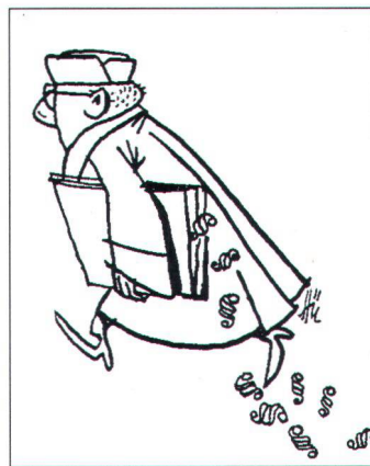
Illustration von Ernst Hürlimann aus «Juristen lachen»

Natur- und Heimatschutzes trotz gelegentlichen Unkenrufen von vereinzelt ewiggestrigen «Volks»- und anderen Interessenvertretern nicht mehr wegzudenken ist.