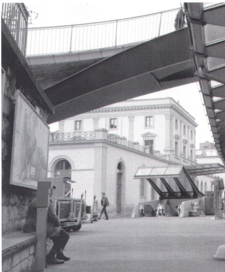
Im Hinblick auf den S-Bahn-Betrieb mussten die SBB den Bahnhof Stadelhofen erweitern. Mit dem Beschwerderecht im Rücken konnte der Heimatschutz eine Lösung erreichen, die sowohl dem Charme des alten Bahnhofgebäudes und dessen städtebaulicher Situation als auch den Bedürfnissen der Bahn gerecht wird

Das hochwertige Ergebnis eines Architekturwettbewerbes für die Erweiterung des Alters- und Pflegeheimes «Steinhof» in Luzern wäre bei der Weiterbearbeitung zugrunde gegangen, wenn nicht der Heimatschutz mit einer Verwaltungsgerichtsbeschwerde die Subventionsverfügung des Bundesamtes für Sozialversicherung angefochten hätte. Er konnte die Beschwerde bald wieder zurückziehen, weil Trägererschaft und Behörden sich sehr schnell zu einer erheblichen Überarbeitung bereit erklärten, die dem wichtigen Baudenkmal und seiner Umgebungsgestaltung gerecht wurde. Der unter Bundesschutz gestellte «Steinhof» ist ein barocker Landsitz und gemäss «Kunstdenkmäler der Schweiz» das «bedeutendste Luzerner Bauwerk des 18. Jahrhunderts». Der Heimatschutz hatte anfänglich die Projektierung einvernehmlich mitverfolgt, wurde dann aber über die Weiterbearbeitung nicht mehr orientiert. Informell erhielt er Kenntnis über tiefgreifende Projektänderungen infolge eines nachbarrechtlichen Rekurses und sah sich vor beinahe vollendete Tatsachen gestellt. Er verlangte eine Begutachtung durch die Eidgenössische Natur- und Heimatschutzkommission und reichte seine