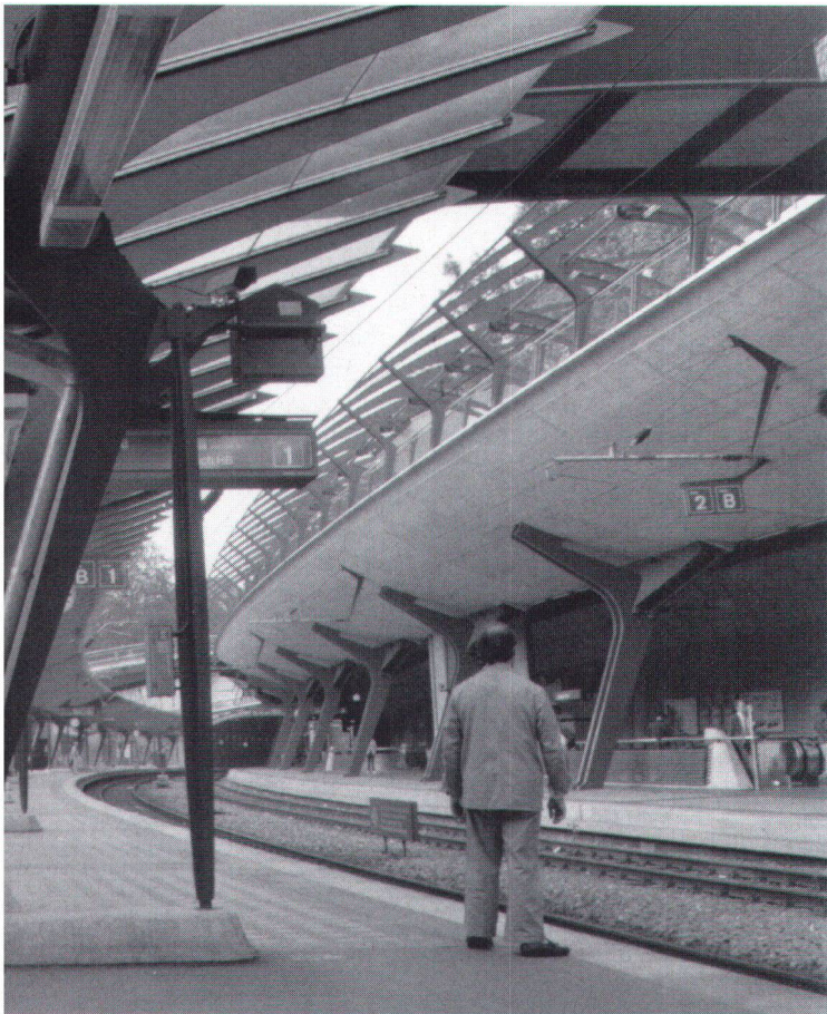
Les CFF ont dû agrandir la gare de Stadelhofen pour l'exploitation du «S-Bahn». Avec son droit de recours en réserve, le «Heimatschutz» a pu obtenir une solution qui sauvegarde le charme de l'ancien bâtiment et de sa situation urbanistique, tout en répondant aux besoins du trafic.

in heutiger Formensprache auf die Eleganz des Bahnhofgebäudes.