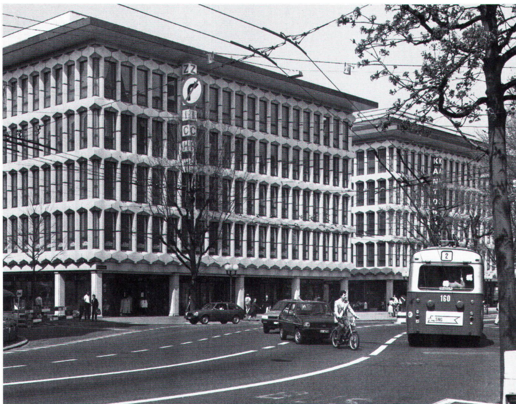
Immer mehr bedrängen im Stadttinnern Bank- und Versicherungsgebäude die angestammten Gewerbebetriebe A l'intérieur de la ville, les entreprises artisanales subissent toujours davantage la pression immobilière des banques et des compagnies d'assurance.

ten festgelegt. Grundvoraussetzung ist, dass Veränderungen eine städtebaulich und architektonisch gute Qualität aufweisen und auf den jeweiligen Ort richtig reagieren. Die Projekte müssen der Stadtbildkommission zur Begutachtung vorgelegt werden. Der Baubewilligungsentscheid wird hier zum reinen Ermessensentscheid.