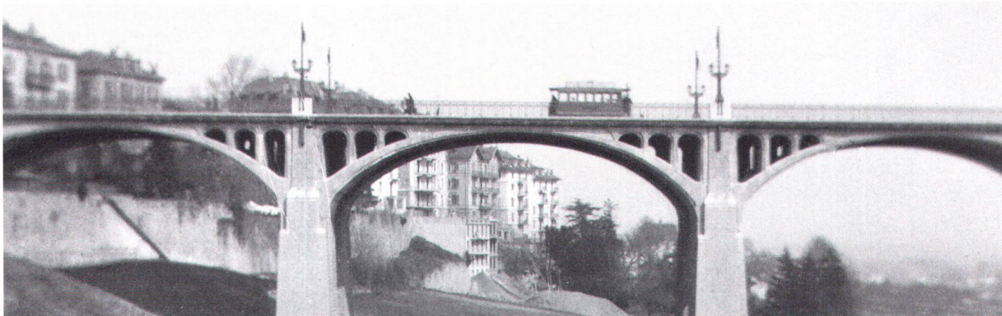
Le pont Chauderon en 1905, avant la création de la plate-forme du Flon. Die Chauderon-Brücke um 1905 vor dem Einbau der Flon-Plattform.

Autour de l'aménagement du Flon à Lausanne