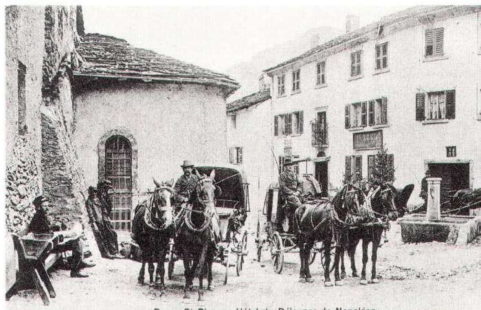
Pässe wie der Grosse St. Bernhard wurden bis in die Postkutschenszeit hinein – unser Bild zeigt eine Szene vor dem Postbüro in Bourg-St-Pierre – intensiver benützt als der Gotthard. (PTT-Museum)

Zu den Schlüsselmerkmalen des helvetischen Strassennetzes gehören zweifellos seine zahlreichen und aufwendigen Tunnel- und Brückenbauten, von denen hier nur die längsten und auch von den internationalen Verkehrsströmen am stärksten benützten Strecken erwähnt seien: die N13 mit dem in den 70er Jahren eröffneten San-Bernardino-Tunnel und die N2 mit dem 1980 dem Verkehr übergebenen Gotthard-Strassentunnel. Insbesondere der letztere, mit seinen 16,3 Kilometern der längste Strassentunnel der Welt und mit seinen Zufahrten zweifellos ein ingenieurtechnisches Meisterwerk, wurde bei seiner Einweihung euphorisch als «Jahrhundertbau» gefeiert. Doch seine Folgen haben nicht lange auf sich warten lassen und den umweltschützerisch motivierten Skeptikern recht gegeben. Jahr für Jahr schnellte auf dieser Strassenachse der private Transitverkehr an, nicht weniger der ökologisch noch bedenklichere