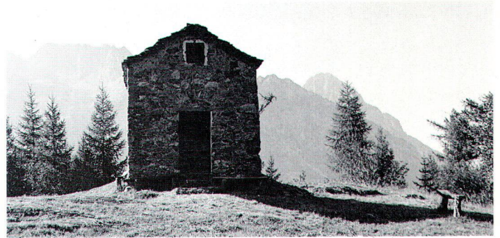
La modeste chapelle veille depuis 1761 sur un alpage dominant la vallée du Trient.

La construction de nouvelles routes d'évitement est une mesure d'aménagement qui induit diverses conséquences sur les sites contournés. Les questions d'accessibilité, de parcage et de vocation des voiries doivent dans un tel cas faire l'objet de réflexions d'ensemble. Par ailleurs, le coût écologique qui peut résulter d'emprises sur des espaces naturels doit être apprécié globalement et des compensations adéquates envisagées. L'étude des tracés et l'intégration «culturelle et paysagère» des ouvrages d'art ainsi que la nature des modifications apportées à une topographie existante sont indissociables de l'approche strictement technique. C'est pourquoi une évaluation prenant en compte les divers aspects et données considérés permet d'intégrer soigneusement le projet aux données d'un site vulnérable. Il n'en demeure pas moins que dans un tel processus, la dimension de la concertation entre les diverses parties intéressées à de tels projets demeure généralement la clef de la réussite.