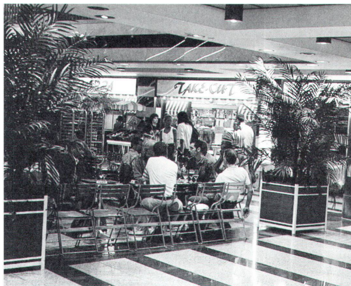
Tropische und teils künstliche Pflanzen in unterirdischen Cafeterien – bald einmal das letzte Grün in einem naturfernen Tagesablauf? (Bild Munz, S-Bahnhof Zürich)

Das allgemeine Zutrittsrecht nach ZGB 699 erstreckt sich nicht allein über den Wald, sondern auch auf Weiden, Gletscher, Firne, Geröllhalden, Felswände, usw., und bildet damit eine rechtliche Basis für Wandertourismus und Alpinismus. (Allerdings, ausgedehnte Gebirgslandschaften stehen streng rechtlich in Privateigentum; so vom Bundesgericht am 7. Dezember 1993 festgestellt für grosse Teile der Berner Alpen.) Eine faktische Privatisierung erfolgt durch den kommerziellen Skisport.