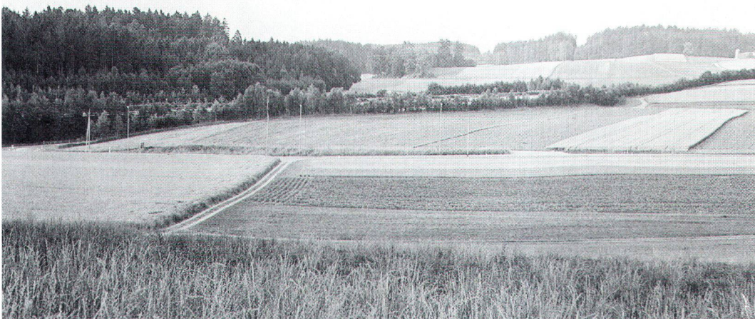
Der Gebüschstreifen mildert zwar den Eingriff der von ihm verdeckten Autobahn, für die Tiere bleibt diese aber eine unüberwindbare Schranke.

Zur Feier des 700jährigen Bestandes der Eidgenossenschaft schuf das Parlament 1991 durch Bundesbeschluss einen besonderen Fonds «für Finanzhilfen zur Erhaltung und Pflege von naturnahen Kulturlandschaften». Wenn auch dieser Fonds mit seinen begrenzten Mitteln nicht flächendeckend, sondern eher exemplarisch wirken kann, so vermag er doch einen wertvollen Beitrag zur Bewahrung des in der Landschaft verkörperten, überlieferten Kulturgutes zu leisten. (Siehe auch Beitrag auf Seite 8 dieser Nummer).