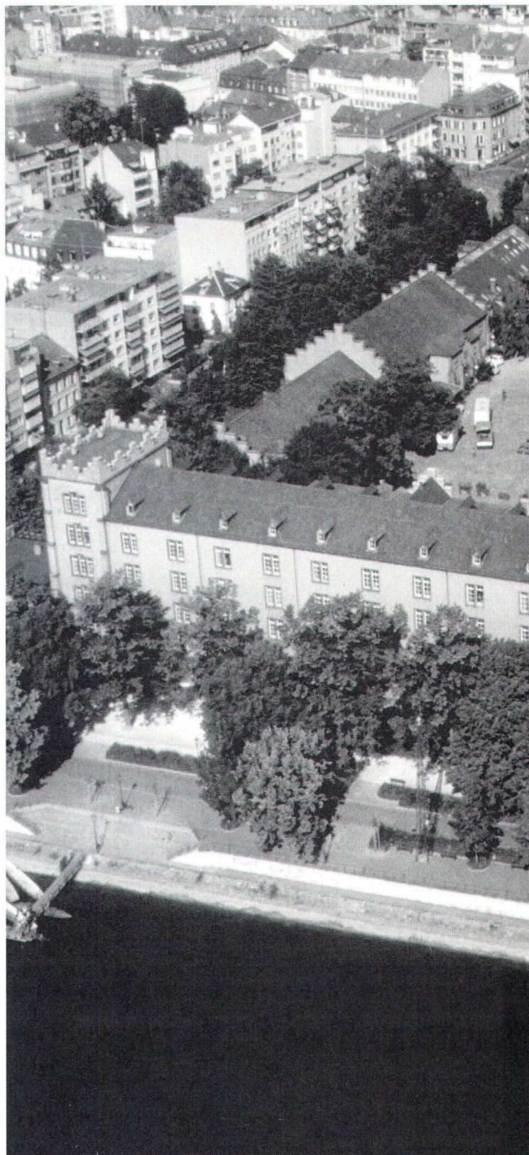
Die neugotische Kaserne Basel wurde 1863 erstellt, 1966 vom Militär wieder verlassen und seit 1974 als Kultur- und Quartierzentrum genutzt.

Die Gründung der ika war durch einen Verein «ENTSTOH-LO» erfolgt, der 1973 an einem ersten öffentlichen Wettbewerb teilgenommen hatte, mit dem die Bevölkerung am Planungsprozess für eine Neunutzung der Kaserne beteiligt werden sollte. Die ersten Mietobjekte waren ein bis dahin als Schuttablagerung benützter kleiner Hof und ein ehemaliger Heuboden mit 800 Quadratmetern Fläche, der als Spielraum für Kinder eingerichtet wurde. Weitere Räume beherbergten später eine Kulturwerkstatt, eine Videogenossenschaft, eine Moschee, Ausstellungsmöglichkeiten für Basler Künstler, ein Frauenzentrum, ein Jugendcafé und einen Seniorenwerkhof der Pro Senectute. Auf dem ehemaligen Exerzierplatz stand zudem während 12 Jahren ein Provisorium des Warenhauses Globus. Im Jahr 1966 wurde das Kasernenareal vom Militär definitiv verlassen und der Einwohnergemeinde Basel übertragen. Es hat also 27 Jahre gedauert, bis es – dank einer Volksabstimmung – endlich von parkierten Autos befreit und offiziell für kulturelle Institutionen «zwischen genutzt» werden konnte. Das Gerangel um dieses zentralgelegene Kasernenareal dürfte weiterdauern – mit einer ika.