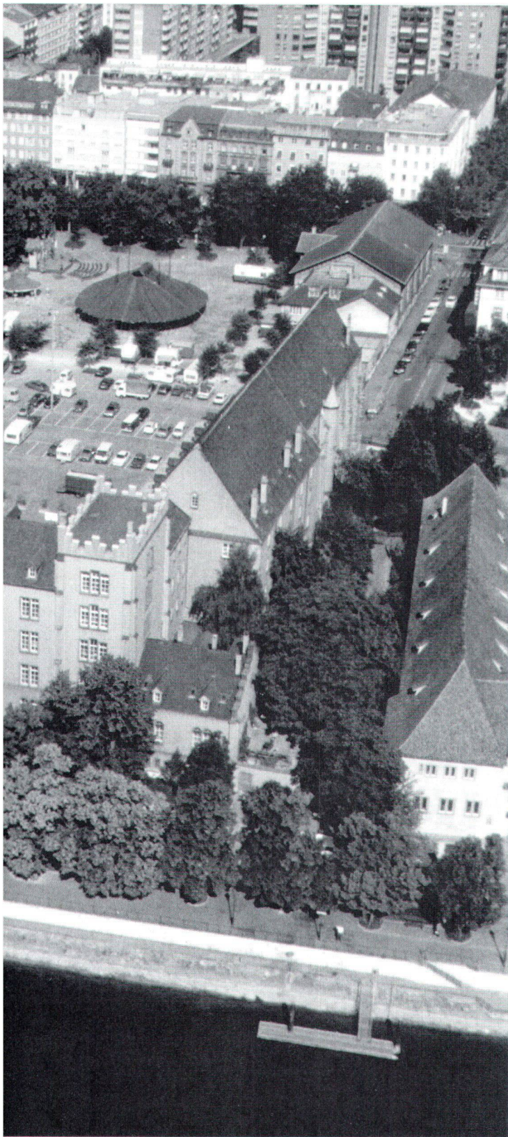
La caserne néo-gothique de Bâle a été édifée en 1863, abandonnée par l'armée en 1966, puis utilisée depuis 1974 comme centre culturel et de quartier.