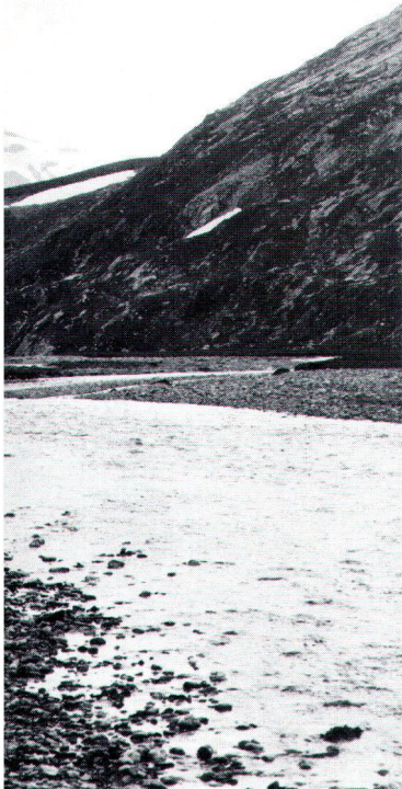
Nun doch keine Bundesgelder zur Erhaltung der Greina?

Man mag gewiss die allgemeinen Sparanstrengungen des Bundes begrüßen. Dennoch darf der Wille des Volkes und des Parlaments nicht in dieser Weise missachtet werden. Es ist inakzeptabel, diesen Gesetzesartikel vor der ersten Anwendung (Fall Greina) bereits zum Scheitern bringen zu wollen. Bezüglich Ausgleichsbeiträge für die Greina-Gemeinden sind seit 1986 nicht weniger als 9 Vorstösse von Bundesparlamentariern eingereicht worden, eine Lösung ist nach 8 Jahren Tauziehen mehr als vordringlich! Diese zu erwartende neuerliche Auseinandersetzung um die Ausgleichsbeiträge im Gewässerschutzgesetz gibt letztendlich allen Parlamentarierinnen und Parlamentariern Recht, die sich seinerzeit für die Einführung eines budgetunabhängigen Landschaftsrappens eingesetzt hatten. Dieses Thema wird nun neuerlich in die Diskussion eingebracht werden müssen.