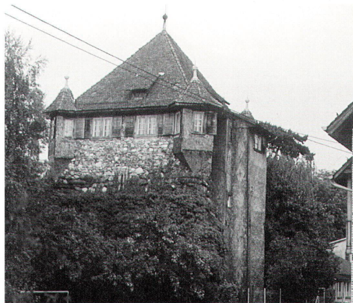
Der Hardturm wird einziger Zeuge der über hundertjährigen Epoche der Schoeller Textilindustrie sein. (Bild Hartmann) La «Hardturm» va être l'unique témoin de l'époque plus que centenaire de l'industrie textile Schoeller.