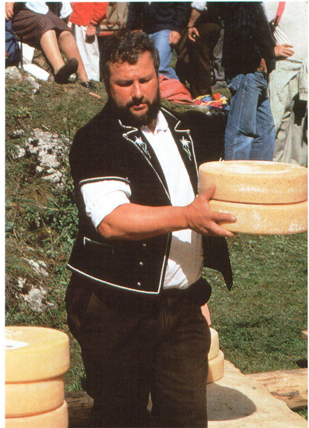
Volksbräuche wie das Käseteilet im Juststal sind längst nicht mehr nur Bauernsache, sondern gehören zur touristischen Attraktion jeder Region.

Um noch einmal auf den multioptionalen Gast zurückzukommen: Seine vielfältigen Bedürfnisse können beispielsweise von historischen Hotels befriedigt werden, die ein wichtiges Angebotselement in der Palette des