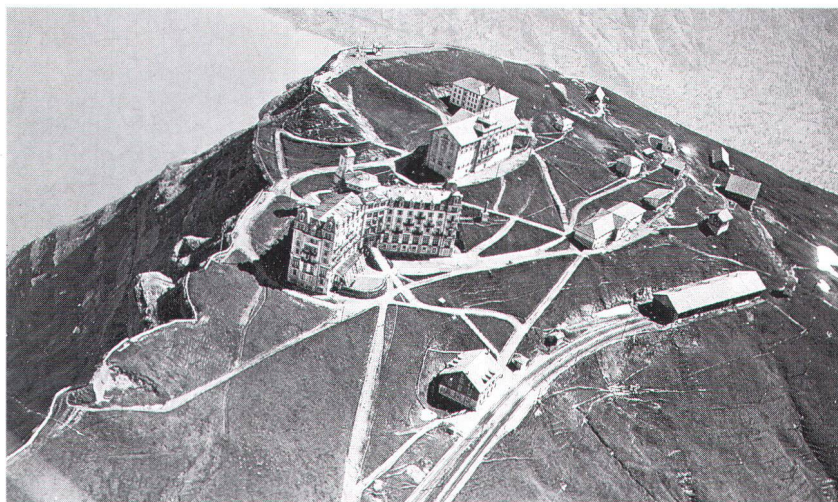
Une épine dans le pied des protecteurs du patrimoine pendant longtemps: la multiplication des infrastructures touristiques sur le sommet du Rigi avant l'«assainissement» de 1951.

L'un des buts du Heimatschutz est alors d'obtenir une loi fédérale pour la protection des paysages et des sites. Il faudra encore attendre longtemps, en vérité, mais c'est grâce ses efforts qu'un article (702) pour la protection des sites et des paysages est introduit dans le Code Civil Suisse, entré en vigueur en 1912. A partir des années 29 et 30 les projets hydro-électriques se multiplient et les deux ligues, «Naturschutz» et «Heimatschutz», se mobilisent pour préserver les sites et paysages les plus précieux: il y a danger en effet pour les chutes du Rhin, dans le canton de Schaffhouse; des menaces