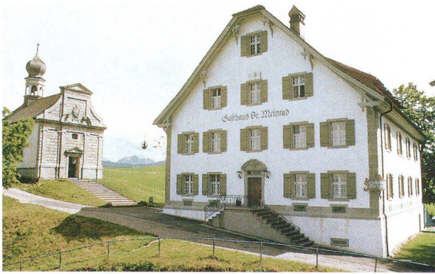
Frühlingswanderung des SHS