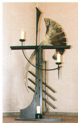
A Mühlehorn, la créativité a libre cours. Kreativität ist in Mühlehorn hoch im Kurs.