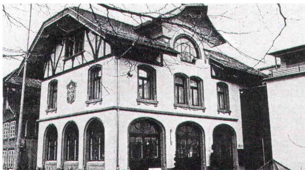
Das Füglistallerhaus in Langenthal – einst Schlosserei, jetzt ein Restaurant. Das hochkarätige Jugendstilhaus konnte dank der Einsprache des Berner Heimatschutzes vor dem Abbruch bewahrt werden.

Tausend Beratungsfälle im Jahr: Die Bauberatung des Berner Heimatschutzes wird getragen von derzeit 45 Bauberatern und Bauberaterinnen, die sieben Regionalgruppen zugeteilt sind. Wie dem kürzlich erschienenen Jahresbericht 1998 der Sektion zu entnehmen ist, sind diese im vergangenen Jahr in 997 Fällen (Vorjahr: 1142) aktiv geworden. Hinter dieser Zahl verbirgt sich eine Vielfalt von Einsätzen. Da geht es zum Beispiel um die sachgerechte Wiederherstellung einer Riegelfassade, die Einordnung eines