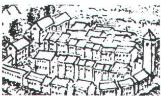
A Erhaltungsziel A Erhalten der Substanz:

Mit Hilfe des ISOS lassen sich geeignete Massnahmen für ein Gebiet oder eine Baugruppe bestimmen.