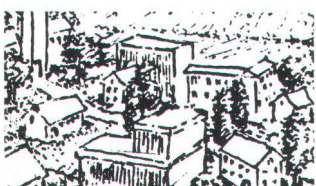
C Erhaltungsziel C Erhalten des Charakters: