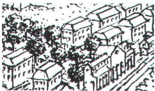
B Erhaltungsziel B Erhalten der Struktur: