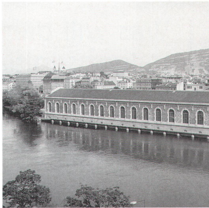
Der Steg an der Aussenseite der zum Kulturzentrum umgebauten Forces Motrices setzt die Dammpromenade am Genfer Rhoneufer fort.

und der alte Bezug der Stadt zum Wasser wieder erlebbar gemacht werden. 1993 gab der «Fonds municipal d'art contemporain» eine Studie zur Aufwertung des Ufer Raumes in Auftrag. Der 1950 gegründete Fonds unterstützt und fördert zeitgenössische Kunst, untersteht der städtischen Exekutive und verfügt über 1% aller Kredite, die an städtische Bauvorhaben und Renovationen gesprochen werden. Die Aufgabe wurde dem Genfer Architekten Julien Descombes anvertraut, welcher gemeinsam mit Künstlern ein Konzept ausarbeitete. Im Bewusstsein um den einzigartigen städtischen Lebensraum am Wasser hiess die Genfer Stadtregierung 1994 das Projekt «Le Fil du Rhône» gut. Damit begann eine intensive Zusammenarbeit zwischen dem Stadtplanungsamt, dem «Fonds municipal d'art contemporain», dem kantonalen sowie dem städtischen Bauamt.