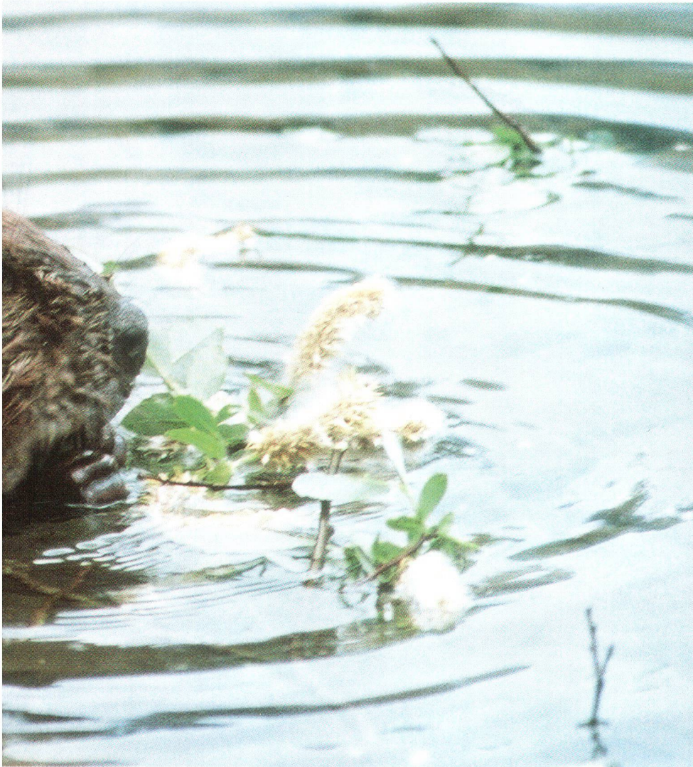
Wieder heimisch geworden, aber immer noch schutzbedürftig: der Biber.