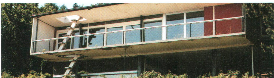
Die Villa Dumas in Villars-sur Glâne La villa Dumas à Villars-sur-Glâne