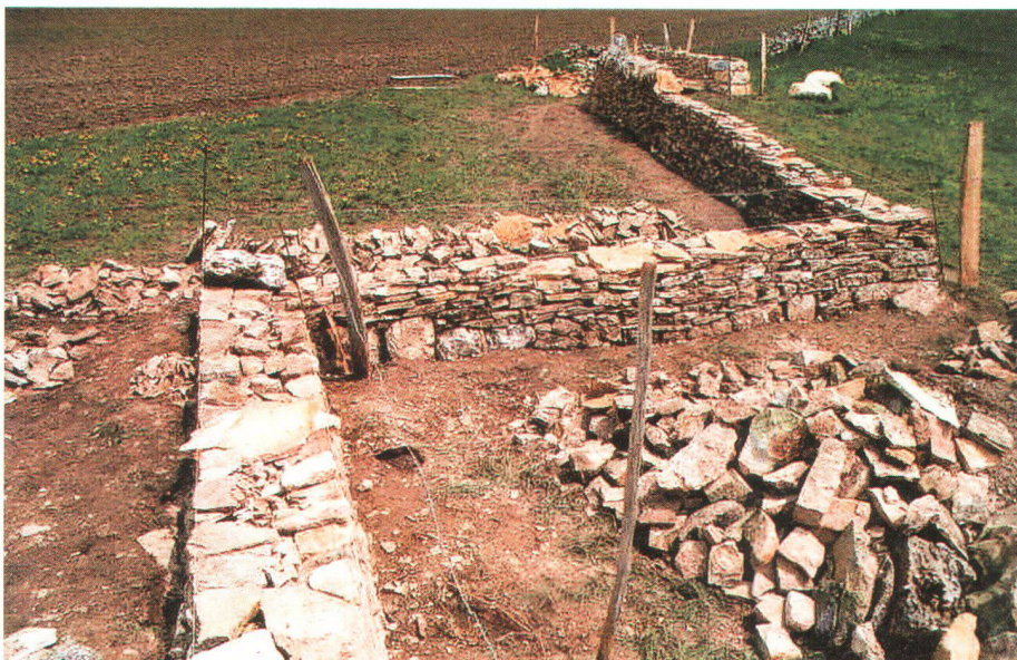
Le Bémont : mur en voie de restauration par la lauréate du prix «Heimatschutz» Eine von der diesjährigen Trägerin des Heimatschutzpreises in Restauration begriffene Mauer in Le Bémont