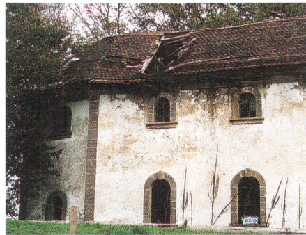
Chapelle Saint-Ulrich à Tasberg (FR), vouée à la ruine

Dem Zerfall preisgegeben: die Ulrichs-Kapelle in Tasberg FR