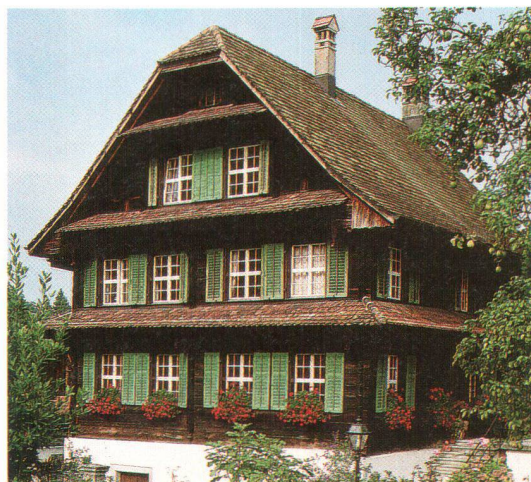
Schlanker, laubenloser Blockbau mit klassizistischer Fassade, erbaut 1705: das Pfarrhaus in Risch

Die weitere Entwicklung des traditionellen Holzbaus betraf nach 1500 vor allem die äussere Form, die Fassadengestaltung (Dekor, Symmetrien, Fensterformen und Farben) sowie das Dach. Im ausgehenden 17. und vor allem im 18. Jahrhundert kam das Zimmerhandwerk zur Blüte, was sich in kunstvoll gestalteten Fassaden und – etwas weniger gut sichtbar – in komplexen Gefügen zeigt. Im Raumkonzept hingegen sind nur geringfügige Änderungen zu beobachten. So befinden sich im Vorderhaus in der Regel eine grössere Stube sowie eine kleinere Nebenstube und dies von ältesten erhaltenen Bauten bis in die 40er-Jahre des 20. Jahr-