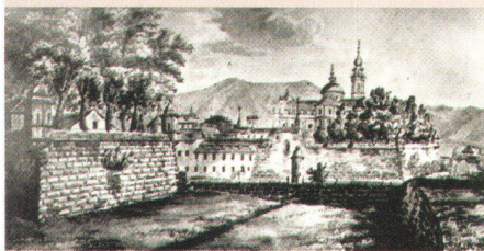
1905 - Kampf um die Turmschanze

Das erste Jahrzehnt heimatschützerischer Tätigkeit ist geprägt von Optimismus und Glauben an die Wirksamkeit der privaten Initiative. Die Interventionen richten sich unter