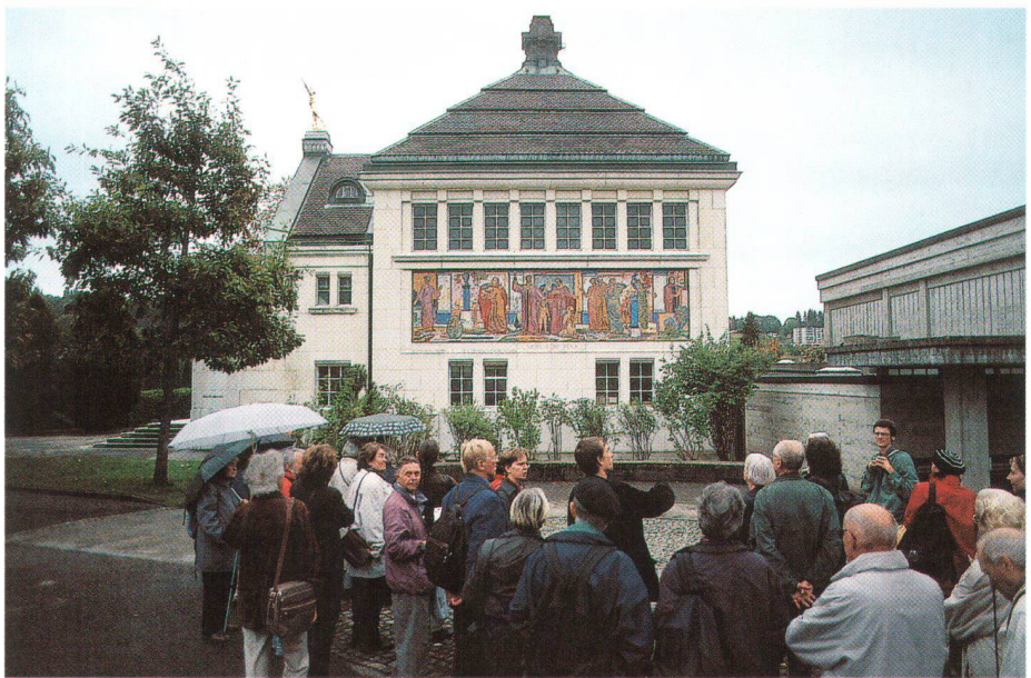
Auf Exkursionen, wie dieser in La Chaux-de-Fonds, lässt sich Baukultur spannend und anschaulich vermitteln