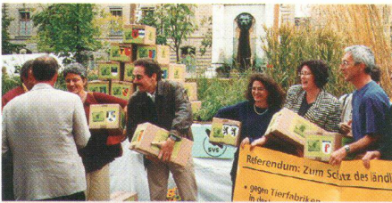
Der SHS unterstützt 1998 das Referendum zum Schutz des ländlichen Raumes