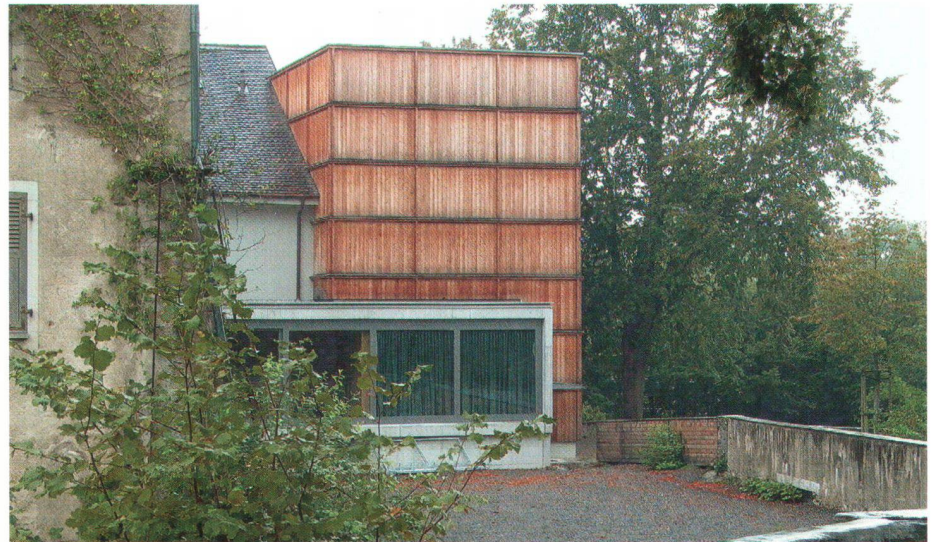
Agrandissement du théâtre municipal en 2000 avec la réalisation d'un foyer et d'une scène par Baumann+Rigling sur les remparts de Sursee