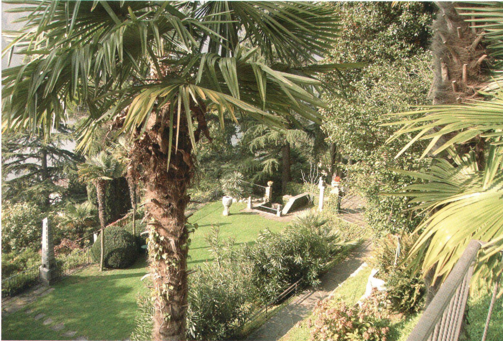
Vor gut 70 Jahren kaufte der St. Galler Arthur Scherrer in Morcote TI ein verwildertes Grundstück am Luganersee und verwandelte es in seinen Traumgarten. Denn hier pflanzte er die verschiedensten exotischen Pflanzen an, die er von seinen Reisen mitbrachte. Heute ist der Park öffentlich zugänglich

Paradiese auf Zeit sollen auch politisch salonfähig werden