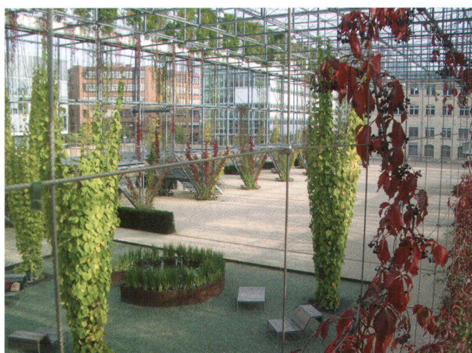
Auf dem ehemaligen Industrieareal hinter dem Bahnhof Oerlikon entsteht seit ein paar Jahren das «Zentrum Zürich Nord». Eigentliches Markenzeichen des Planungsgebietes sind die neuen Parkanlagen, worunter der MFO-Park. Er ist ein begehrtes Stahlgerüst, das von verschiedenen Kletterpflanzen überwuchert wird

Im März startet die Wanderausstellung «Stadtpark», die in verschiedenen Landesteilen gezeigt werden soll